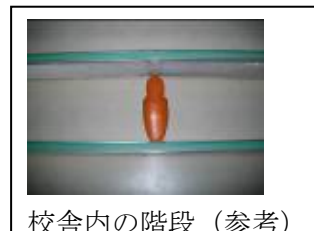
校舎内の階段 (参考)